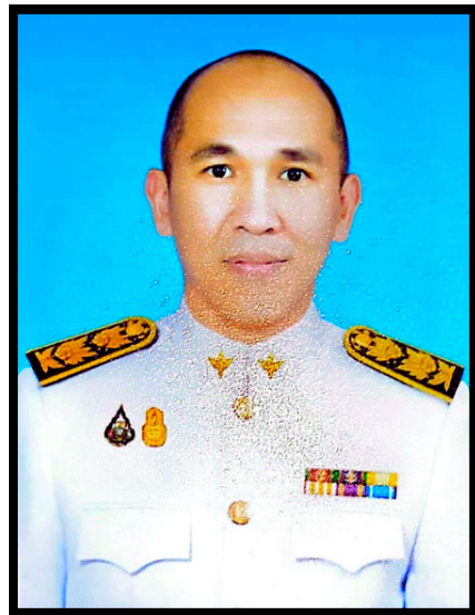
นายมนตรี หนองคาย นายแพทย์ชำนาญการพิเศษ (ด้านเวชกรรมป้องกัน) รองนพ.สสจ. คนที่ 1